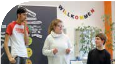
„Miteinander Leben Lernen“ bietet eine vielfältige Auswahl an Programmen an