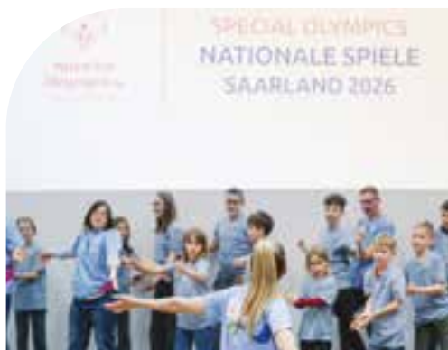
Teil einer großen Gemeinschaft

Neben den sportlichen Aktivitäten legt die Organisation großen Wert auf Gesundheitsförderung durch regelmäßige Gesundheitschecks und Aufklärungsprogramme. Trainer und Betreuer werden kontinuierlich wei-