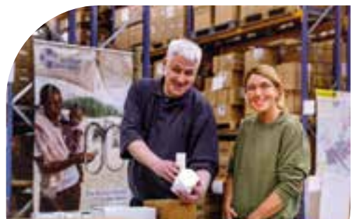
Eine besondere Möglichkeit, um berufliche Barrieren zu überwinden

QR-Code: Infos und Anmelde-möglichkeiten für Werkstätten und Unternehmen