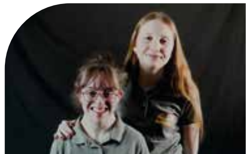
Musical „Alles ist möglich“: Ein lebendiges Beispiel dafür, wie Kunst Barrieren überwinden und Menschen zusammenbringen kann.

QR-Code: Tickets und mehr Infos zu „Alles ist möglich“