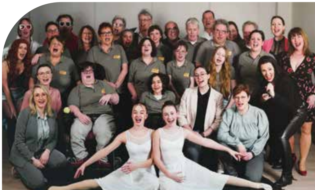
Rollenbesetzung des Musicals „Alles ist möglich“.